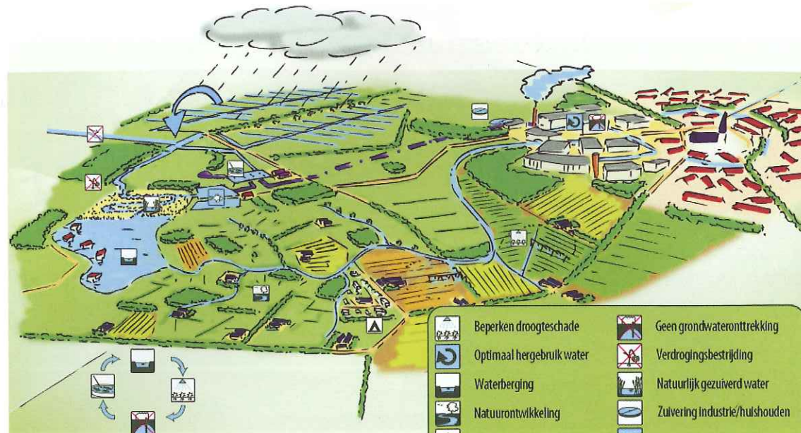
Schets van de Waterhouderij.

ILLUSTRATIE: INNOVATIENETWERK TRANSFORUM, AEQUATOR GROEN & RUIMTE