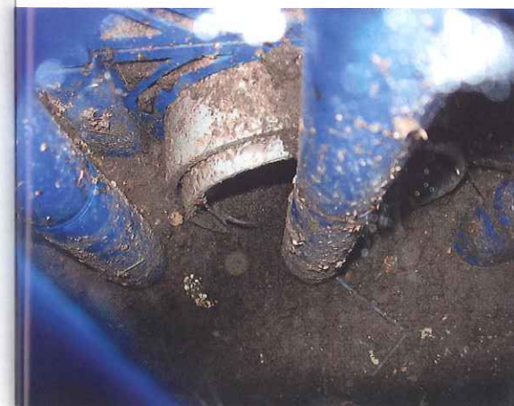
Dichtgeslibde bodem van infiltratie-element.

Om inzicht te krijgen in het milieutechnisch functioneren