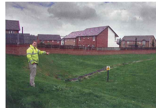
Wadi in het Schotse Dundee, met grotere dimensies door zwaardere hydraulische eisen dan elders in Europa.

De voorkeur gaat vaak uit naar oppervlakkige afvoer en infiltratie vanwege de zichtbaarheid: dit vergroot de beleving en betrokkenheid van bewoners en de visuele controle op goede werking van het systeem. Zo zijn door het regenwater boven het maaiveld af te voeren, foutieve aansluitingen beter controleerbaar en vinden dergelijke lozingen minder vaak plaats. De inpassing van goten in het openbaar gebied en tuinen verdient aandacht om barrièrewerking voor bijvoorbeeld fietsers, rollators en kinderwagens te beperken of te voorkomen en problemen in de winter